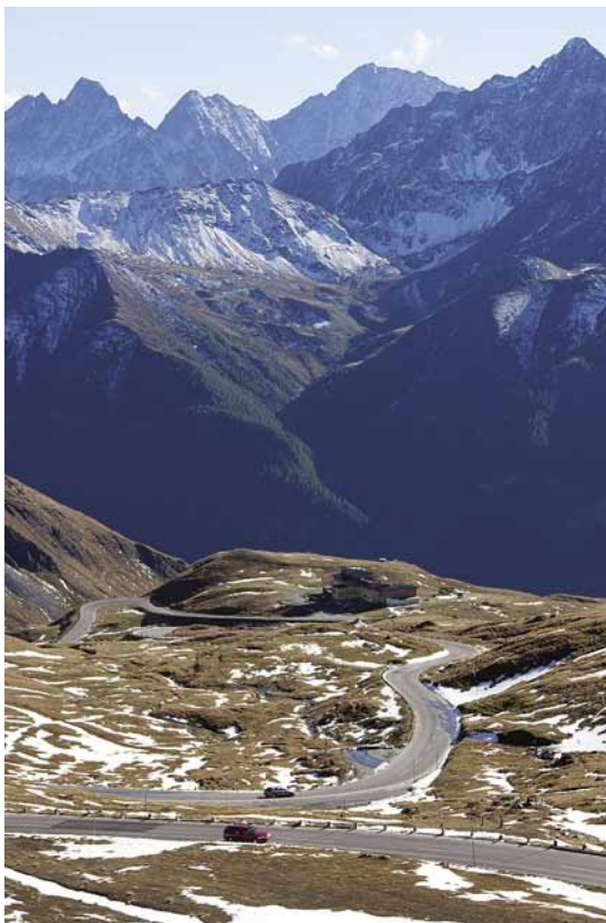
Großglockner Hochalpenstraße, AT

Is it better to go by car or by train? Read the statements and answer the questions below.