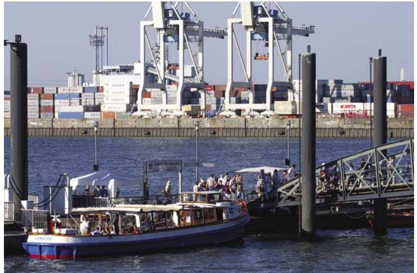
Hafenfährlinie 62, Hamburg