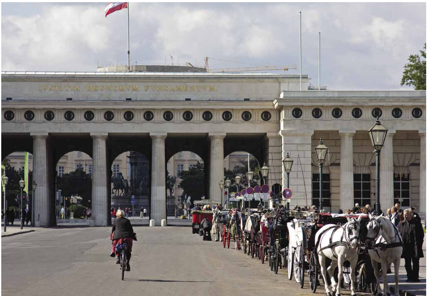
Fiaker vor dem Äußeren Burgtor

1 book fair 2 fairgrounds; exhibition site